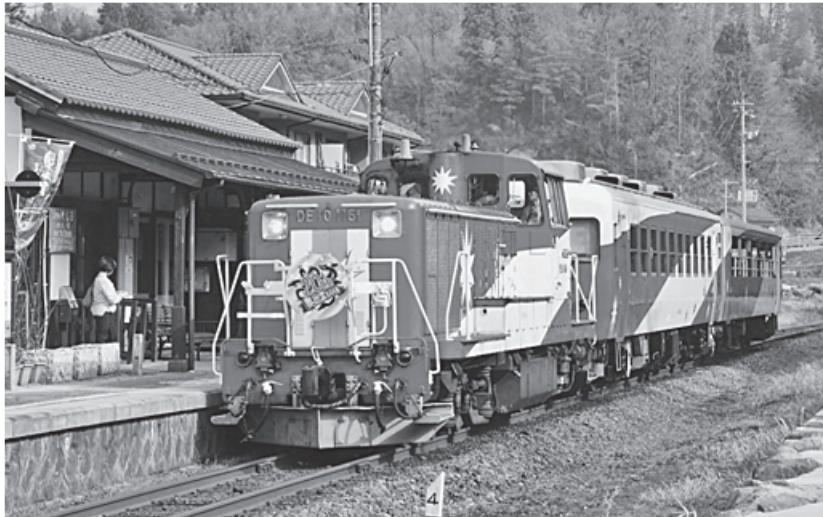
ラストラン間近なトロッコ列車

質問 大量輸送手段としての役割は終わった感のある鉄道。今後は観光や地域振興を主題とした持続活動が必要。「マイルール」との認識で沿線住民が活動するためにも駅舎の解放が必要。また引退後の